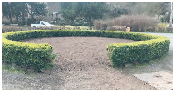
Neugestaltung Kurpark Ilfeld