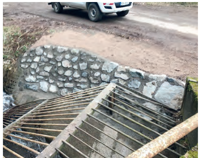
Hangsicherung Kurpark Neustadt, Erneuerung Durchlass Osterode, Einlaufbauwerk Ilfeld - Maßnahmen nach Starkregen ereignissen