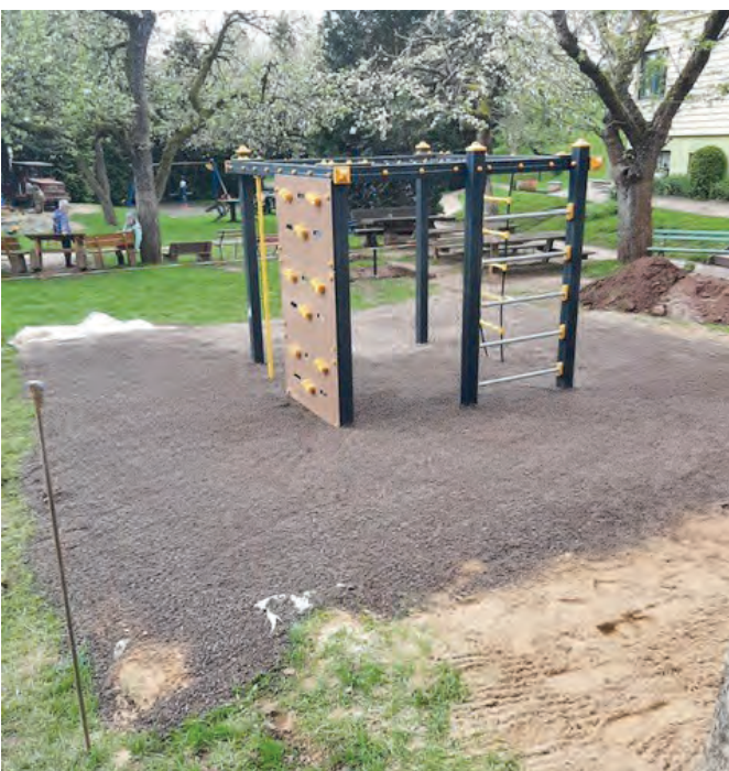
Spielplatz Kita „Regenbogen“ in Neustadt