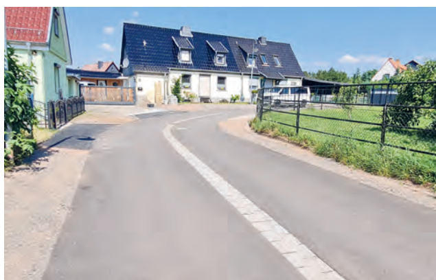
Sanierung - August-Bebel Ring und Fichtenweg