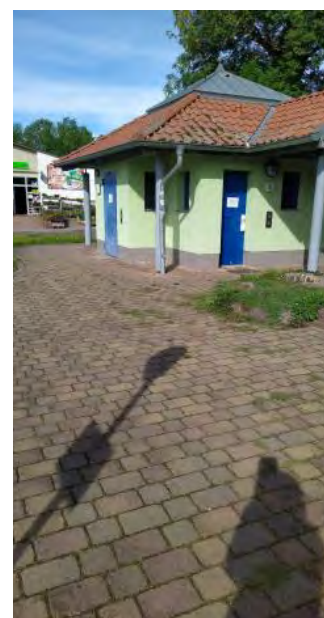
Neubau Bushaltestelle „Wiesenplatz“ Neustadt mit virtueller Ortsinformation