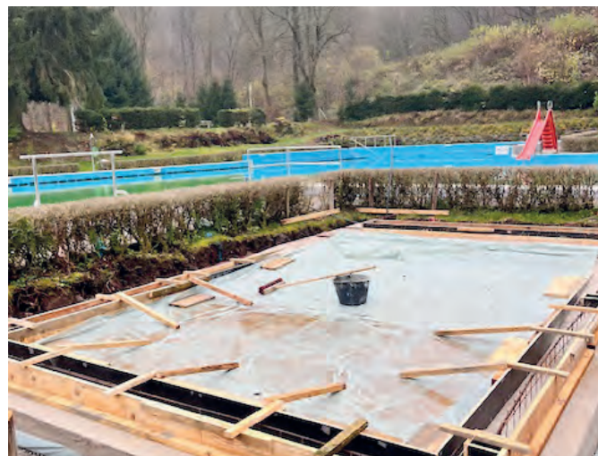
Neuerrichtung Bodenplatte Kinderbecken Freibad Ilfeld