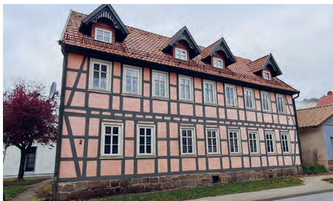
Energetische Sanierung Wohngebäude Harzstraße 2

wird die Brücke zum Freibad Neustadt instandgesetzt.