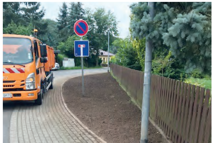
Arbeiten zur Erneuerung Tretbecken Neustadt, Brücke Harzungen, Wegebau