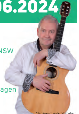
*Programm unter Vorbehalt

soweno Seniorenheim Haus Harztor, Rhodomanstraße 1c, 99768 Harztor OT Niedersachswerfen