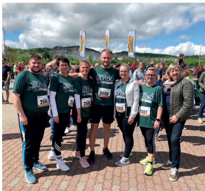
Läuferteam 2024 der Neanderklinik